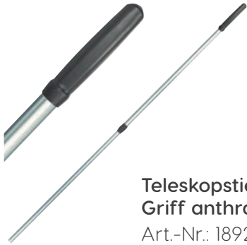
Teleskopstiel Ø 23,5 mm Griff anthrazit Art.-Nr.: 18923